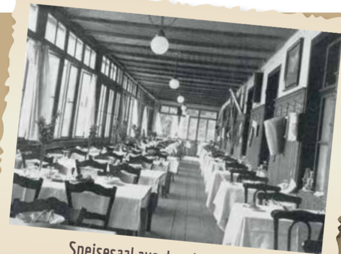
Speisesaal aus dem Jahre 1920

Die Idee dahinter sind einzigartige Begegnungen mit der Tradition des Hauses im stilsicheren Wechsel mit zukunftsweisender Technik, wohl temperiert und eingebettet in ein persönliches Ambiente – Speisen an einer der ersten Adressen am See.